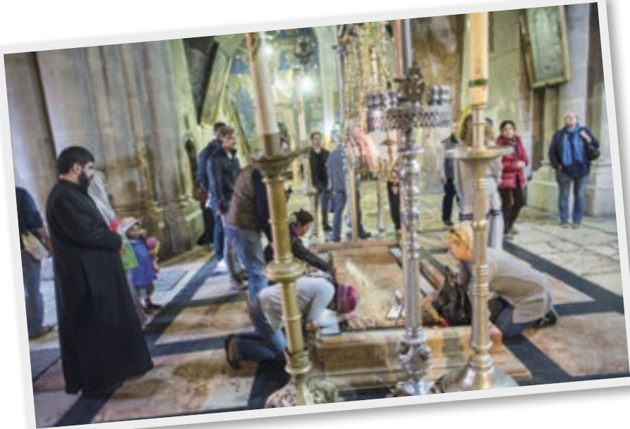
Die Grabeskirche liegt in der Altstadt von Jerusalem. Sie wird von sechs christlichen Konfessionen verwaltet.

Situation wird sowohl von deutschen als auch von anderen internationalen Reiseunternehmen leider vielfach stillschweigend hingenommen. Es fällt bei Reisen ins Heilige Land offensichtlich schwer, die politische und völkerrechtliche Komplexität konkret anzusprechen, obschon sich doch die wichtigsten Pilgerziele auf palästinensischem Gebiet befinden (Grabeskirche, Ölberg, Via Dolorosa, Geburtskirche, Hirtenfelder, Herodium, Jordan-Tal, Jericho oder Abrahams Grab). Von daher wäre es für Veranstalter von Pilgerfahrten dringend geboten, zur entsprechenden Sensibilisierung von Touristinnen und Touristen beizutragen und für ausgewogene Reiseprogramme zu sorgen.