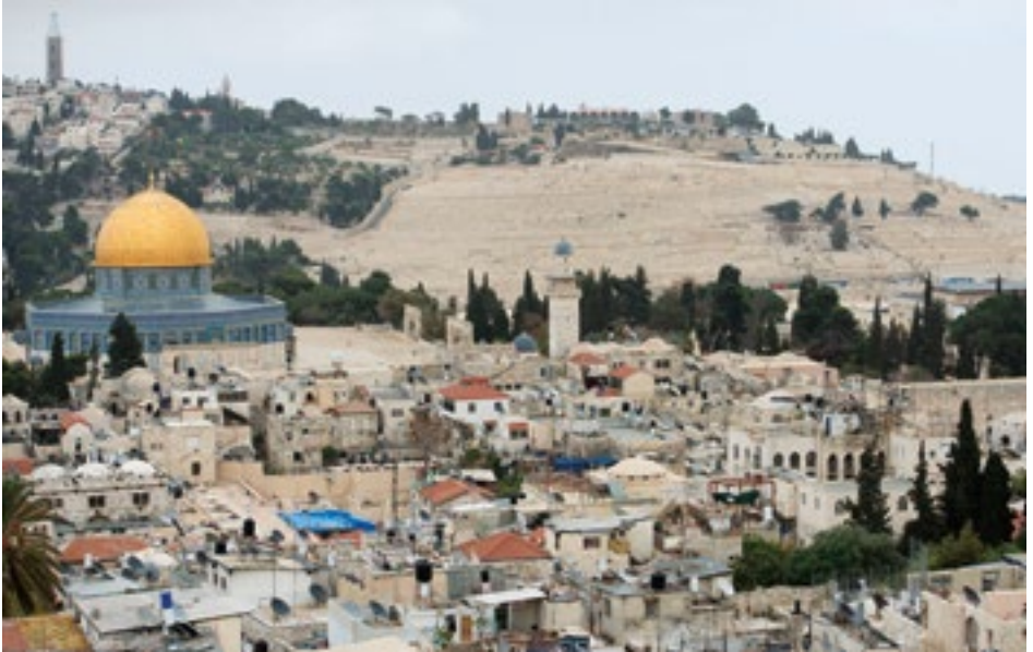
Blick auf den Felsendom und die Altstadt von Jerusalem.

Das Heilige Land ist faszinierend – das spürt fast jeder, der hierher kommt. Die multireligiöse Vielfalt, Begegnungen von Menschen aus aller Welt und die heiligen Stätten ziehen seit Jahrhunderten Reisende an. Doch viele Besucherinnen und Besucher empfinden auch Beklemmung und Unsicherheit, wenn sie beispielsweise Pilgergruppen sehen, die beim Gang durch das Jaffa-Tor in der Altstadt Jerusalems von israelischen Polizisten oder Sicherheitsdiensten eskortiert werden. Verbunden mit der internationalen Medienberichterstattung erscheint so die Jerusalemer Altstadt schnell als gefährliches Terrain für Reisende. Aber das ist nur sehr selten der Fall.