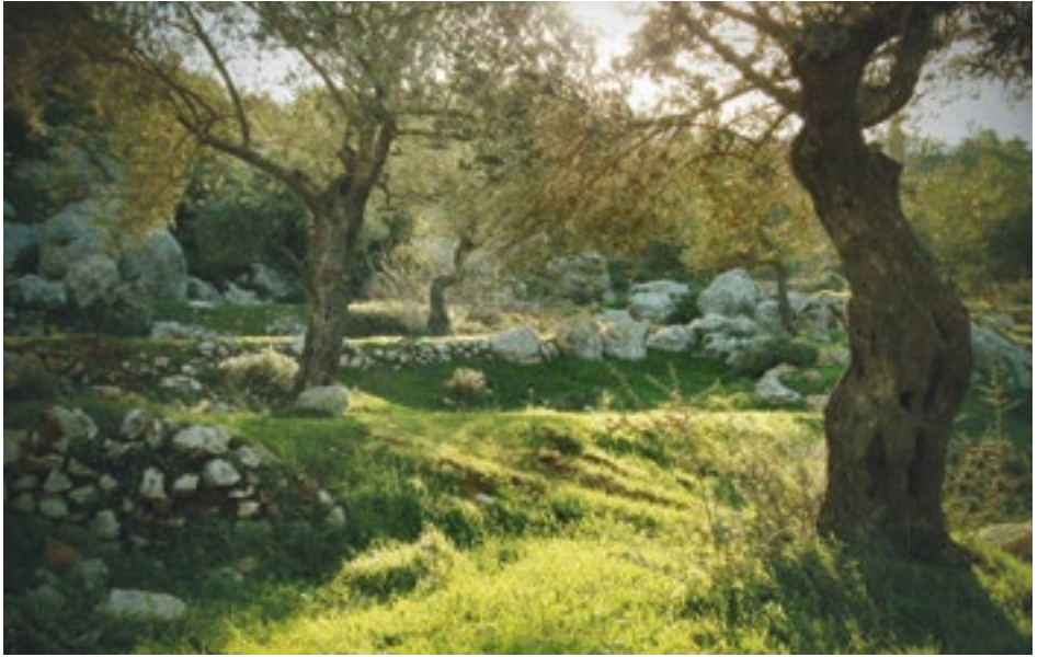
Die Olivenbäume in der Nähe des Klosters Creminsan bei Beit Jala, werden von einem christlichen Bauern bewirtschaftet.

verbreitete Annahme, Jerusalem sei die ungeteilte Hauptstadt Israels. Doch dieser Status ist international nicht anerkannt. Aus diesem Grund befinden sich die meisten ausländischen Botschaften, auch die deutsche, in Tel Aviv.